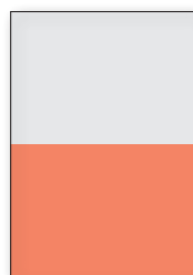
1/2 Seite quer 210 × 145 mm